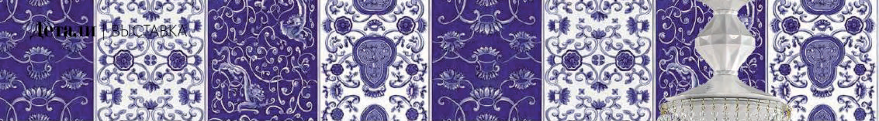
Текстиль Chinese Garden, MEISSEN COUTURE www.meissen.com